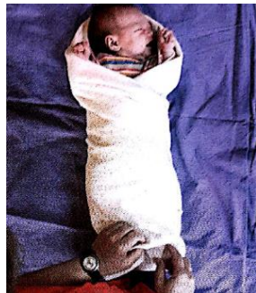
(Jahn-Zöhrens, 2005, S.101)