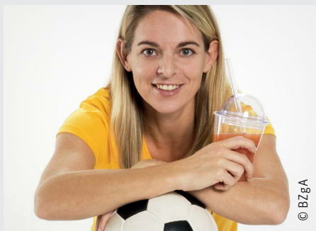
Botschafterin von „Alkoholfrei Sport genießen“